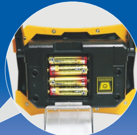
一般的な単3電を採用！