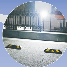
高輝度COBチップ採用